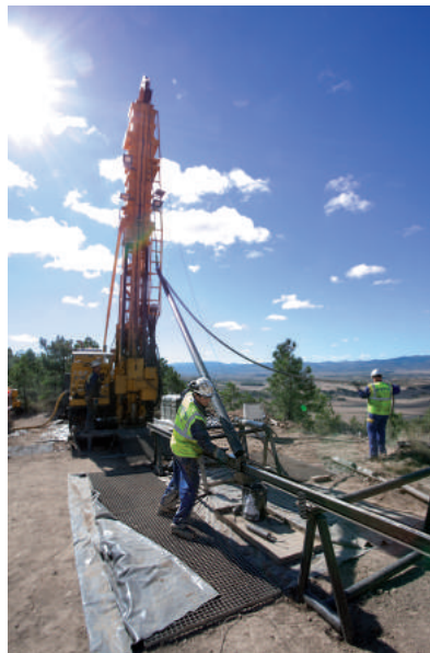
Trabajos de sondeos en la región