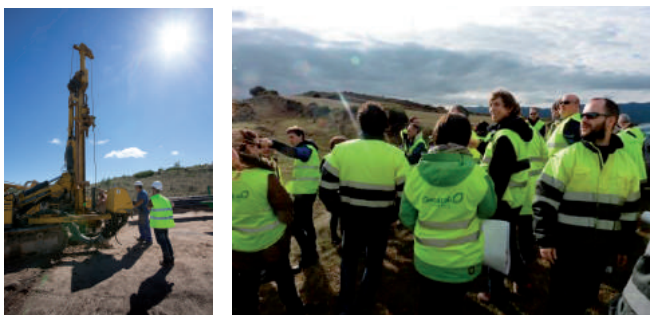
Exploración de la región