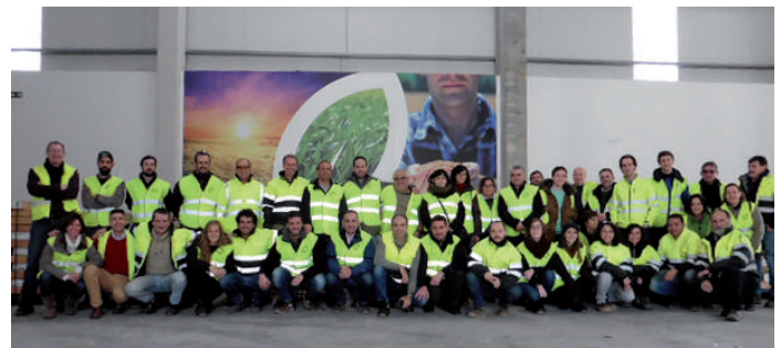
Foto de equipo