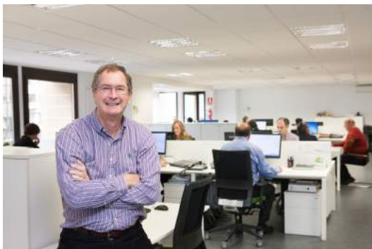
Director Ejecutivo en las oficinas de Geoalcali