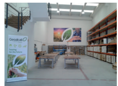
Naves de Geoalcali